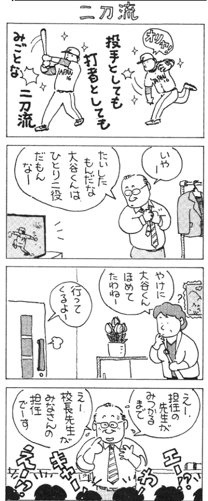
『クレスコ 2023年5月』より