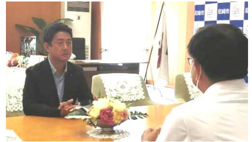
↑ 松本市長(左)と中川委員長(右) (市役所にて)